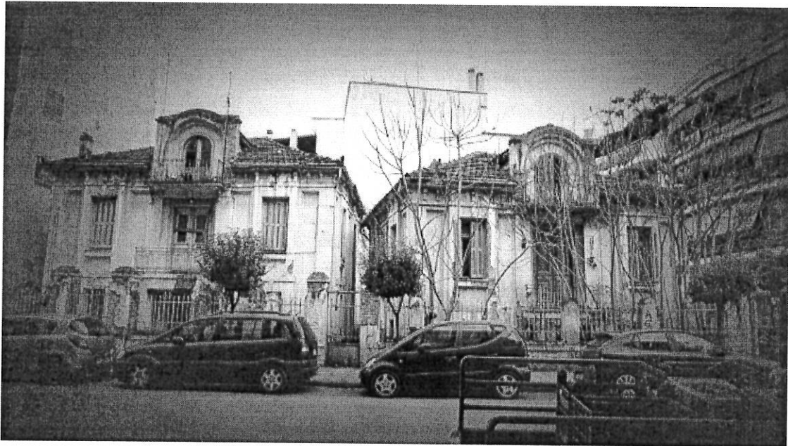
Οι δίδυμες κατοικίες επί της οδού 31ης Αυγούστου

Σχετικά με το αντικείμενο του θέματος θέτουμε υπ' όψη του Συμβουλίου τα παρακάτω: