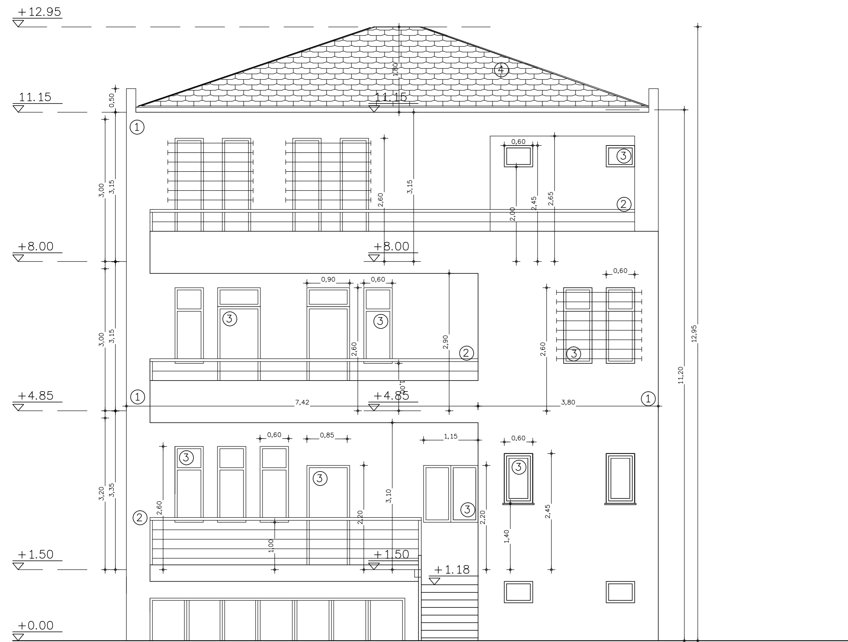
ΠΙΣΩ ΟΨΗ (ΝΟΤΙΑ)