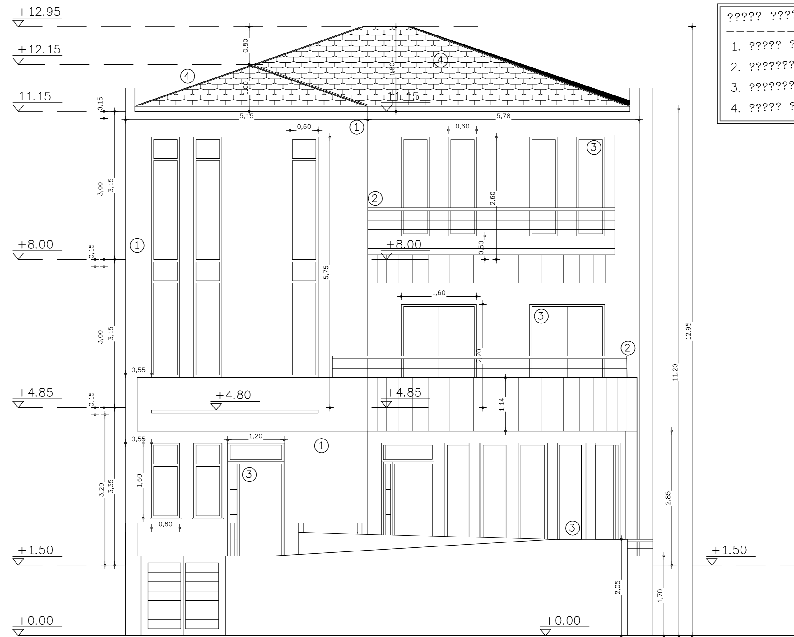
ΠΡΟΣΩΨΗ (ΒΟΡΕΙΑ ΟΨΗ)