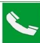
Τηλέφωνο για διάσωση και πρώτες βοήθειες

Όταν πρέπει να δείξουμε την κατεύθυνση που πρέπει να ακολουθήσουμε για να φτάσουμε στα μέσα βοήθειας ή διάσωσης τότε τα αντίστοιχα σήματα συνδυάζονται ανάλογα με τα παρακάτω σήματα κατεύθυνσης