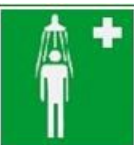
Θάλαμος καταιονισμού ασφαλείας