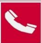
Τηλέφωνο για την καταπολέμηση πυρκαγιών

Όταν πρέπει να δείξουμε την κατεύθυνση που πρέπει να ακολουθήσουμε για να φτάσουμε στον πυροσβεστικό εξοπλισμό τότε τα αντίστοιχα σήματα συνδυάζονται ανάλογα με τα παρακάτω σήματα κατεύθυνσης