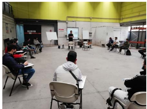
Εκπαίδευση στην Ανδαλουσία (Ισπανία)