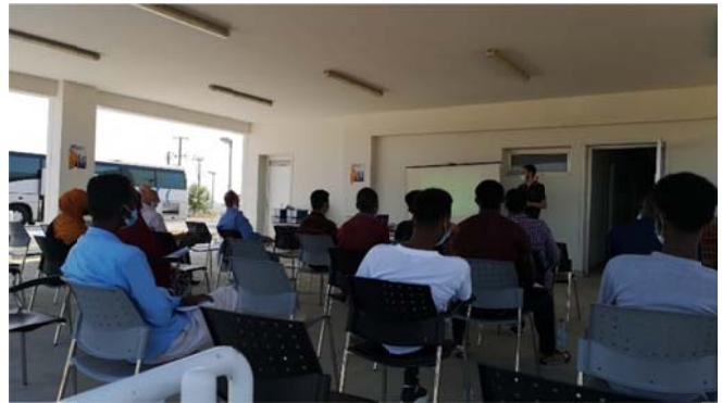
In2C εκπαίδευση στην Κύπρο