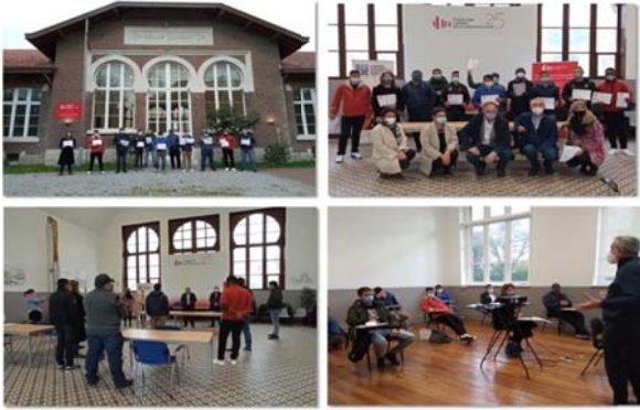
Εκπαιδευτικά προγράμματα στην Κανταβρία (Ισπανία)

Δείτε παρακάτω μερικές εικόνες των εκπαιδευτικών προγραμμάτων του In2C σε: Ισπανία (Κανταβρία, Ανδαλουσία και Κανάρια Νησιά) και Κύπρο: