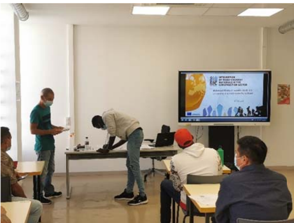
Εκπαίδευση στα Κανάρια Νησιά (Ισπανία)